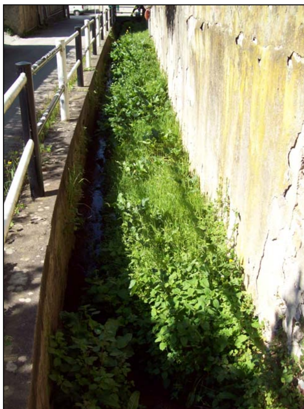
Foto 3 – Fosso Cimitagna, lungo via di Cavina, che raccoglie le acque di drenaggio del muro